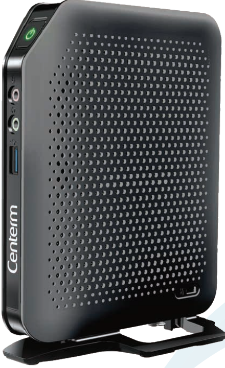
Centerm C92-Z28 Thin Client

C92-Z28 Thin Client, yoğun işlemci ve grafik kullanımı gerektiren uygulamalarda üstün performans sağlaması için geliştirildi.